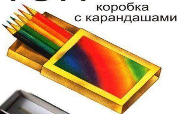
коробка с карандашами