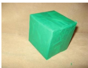
Обклеенная бумагой коробка.