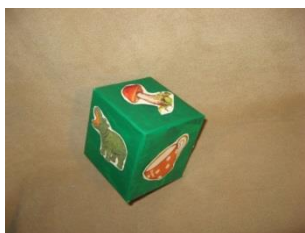
Артикуляционный кубик с картинками по названию упражнений «Бегемотик», «Грибок», «Чашечка»,...

Упражнения, проводимые в игровой форме, основаны на произвольных движениях. Упражнения не утомляют ребенка, не вызывают негативных реакций и отказа от выполнения в случае неудачи.