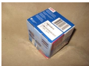
Картонная коробка по форме кубика.

Ребенок бросает кубик и выполняет определенное артикуляционное упражнение в соответствии с картинкой, выпавшей на кубике.